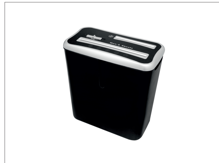
Skartovací stroj Wallner XD 805CD